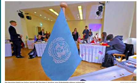
Die Vereinten Nationen haben wegen der Ukraine in Aschersleben eine Zwischenklausur einberufen.

Jugendliche der Adam-Olearius-Schule und der Berufsbildenden Schule schlüpfen in die Rollen von Regierungschefs, Ministern und Diplomaten. Beim Planspiel POLARS wird verhandelt.