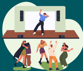
Gemeinsam feiern & Weltkindertag