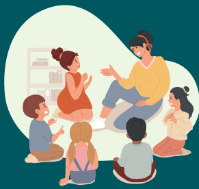
Hochwertige Bildung für alle