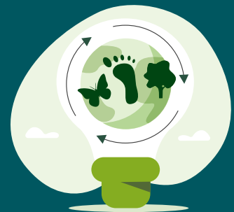
Biodiversität & Umweltschutz