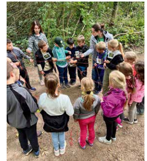
Auch in diesem Jahr war die Schutzgemeinschaft Deutscher Wald unter anderem mit dem Projekt „ErlebnisWALD“ dabei.

Das Ziel der Nachhaltigkeitswoche ist und bleibt: Es soll Wissen vermittelt, zum Mitmachen angeregt und zum gemeinsamen Spaß haben aufgefordert werden. Der nun schon fest zum Programm gehörende Auftaktveranstaltung für die Schulen am