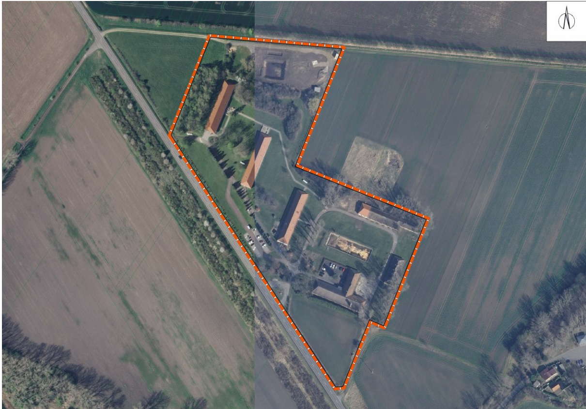
Abb. 1 Strukturelle Situation des Plangebietes – Luftbild (Abgrenzung Plangebiet rote Strichlinie)

Die Gebäude und baulichen Anlagen sind nutzungsgemäß durch Wege und befestigte Flächen erschlossen und durch Stellplätze sowie großzügige Freibereiche (Terrassen, Grünräume) ergänzt. Das ausgedehnte Grundstück weist erhaltenswerten und strukturgebenden Baumbestand und Gehölzbewuchs auf. Das Gelände ist eben, weist eine Geländehöhe von 113 m bis 114 m über NN auf und liegt auf der Höhe der erschließenden Wilslebener Chaussee. Das Plangebiet ist unmittelbar von landwirtschaftlichen Nutzflächen umgeben.