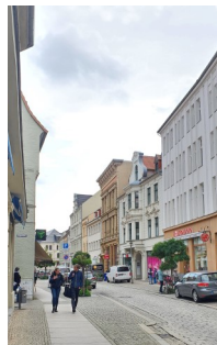
Breite Straße, 2020

Wie werden die Ausgleichsbeträge ermittelt? Die sanierungsbedingte Bodenwerterhöhung ergibt sich aus dem Unterschied zwischen dem Bodenwert, der sich für ein Grundstück ergeben würde, wenn eine Sanierung nicht beabsichtigt oder durchgeführt worden wäre (der sogenannte Anfangswert) und dem Bodenwert, der sich für ein Grundstück durch die rechtliche und tatsächliche Neuordnung des förmlich festgelegten Sanierungsgebiet ergibt (der sogenannte Endwert). Dabei entspricht der Anfangswert nicht dem tatsächlichen Wert zu Beginn des Sanierungsverfahrens, sondern dem fortgeschriebenen Bodenwert zum Zeitpunkt der Erhebung der Ausgleichsbeträge. Für das Sanierungsgebiet „Aschersleben-Innenstadt“ erfolgte die Ermittlung der besonderen Bodenrichtwerte, also der Anfangs- und Endwerte, durch den Gutachterschuss für Grundstückswerte für den Regionalbereich