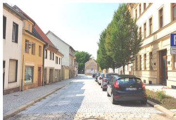
Liebenwahncher Plan, 2020

Im rund 67 Hektar großen Sanierungsgebiet "Aschersleben-Innenstadt", das etwa 810 bebaute Grundstücke umfasst, die sich zum Großteil im privaten Eigentum befinden, wurden seit 1991 insgesamt 139 Maßnahmen der Vorbereitung (Gutachten, Modernisierungsvoruntersuchungen, Tätigkeiten des Sanierungsträgers), 236 Ordnungsmaßnahmen (Straßenausbau, Kanalbau, Sicherung an gefährdeten Objekten) und 627 Baumaßnahmen durchgeführt. Von den 627 Baumaßnahmen entfallen 454 Maßnahmen auf die Instandsetzung von meist privaten Wohnobjekten. Diese teils kleinteiligen Maßnahmen (Dach, Fenster, Fassade) tragen erheblich zur Stadtansicht, wie man sie heute kennt, bei.